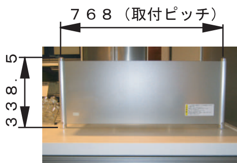
ガス前用ハーフガラスBタイプ